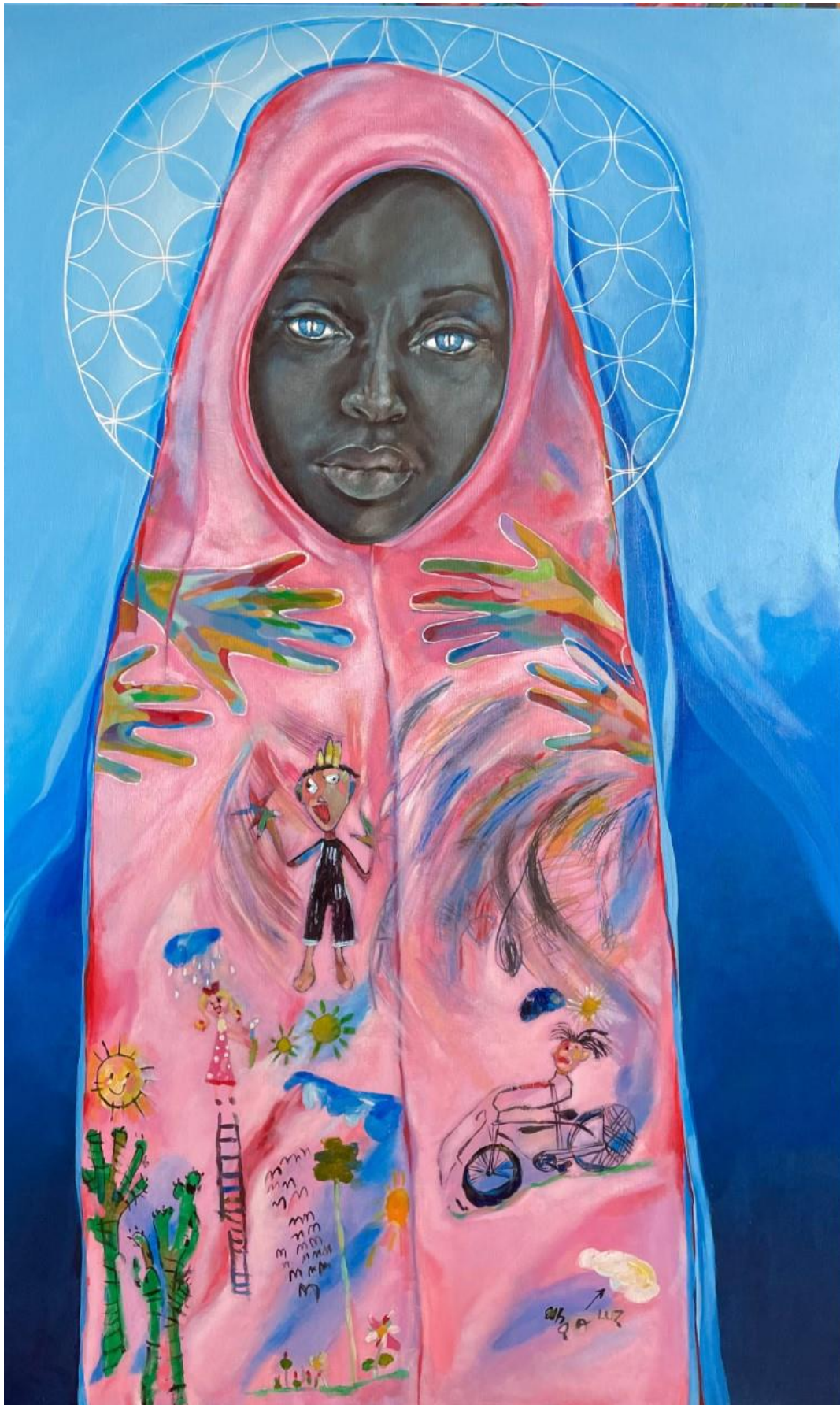
Acrílica sobre tela "Garatuñas" / 116cm x 77 cm – 2022.