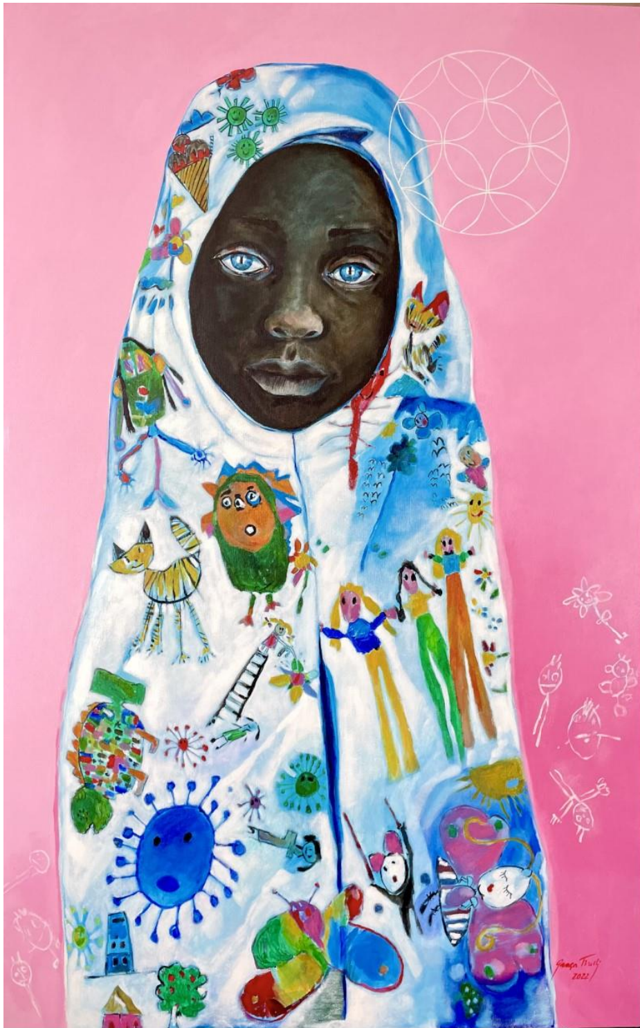
Acrílica sobre tela – Serie Os Submersos/ 105cm x 77 cm . 2022