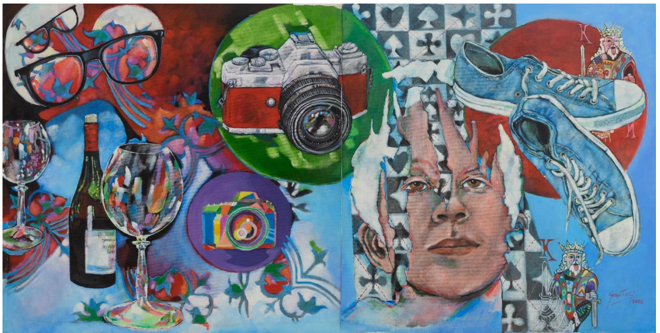
Acrílica sobre tela "The Mad King" / 55cm x 110 cm . 2019