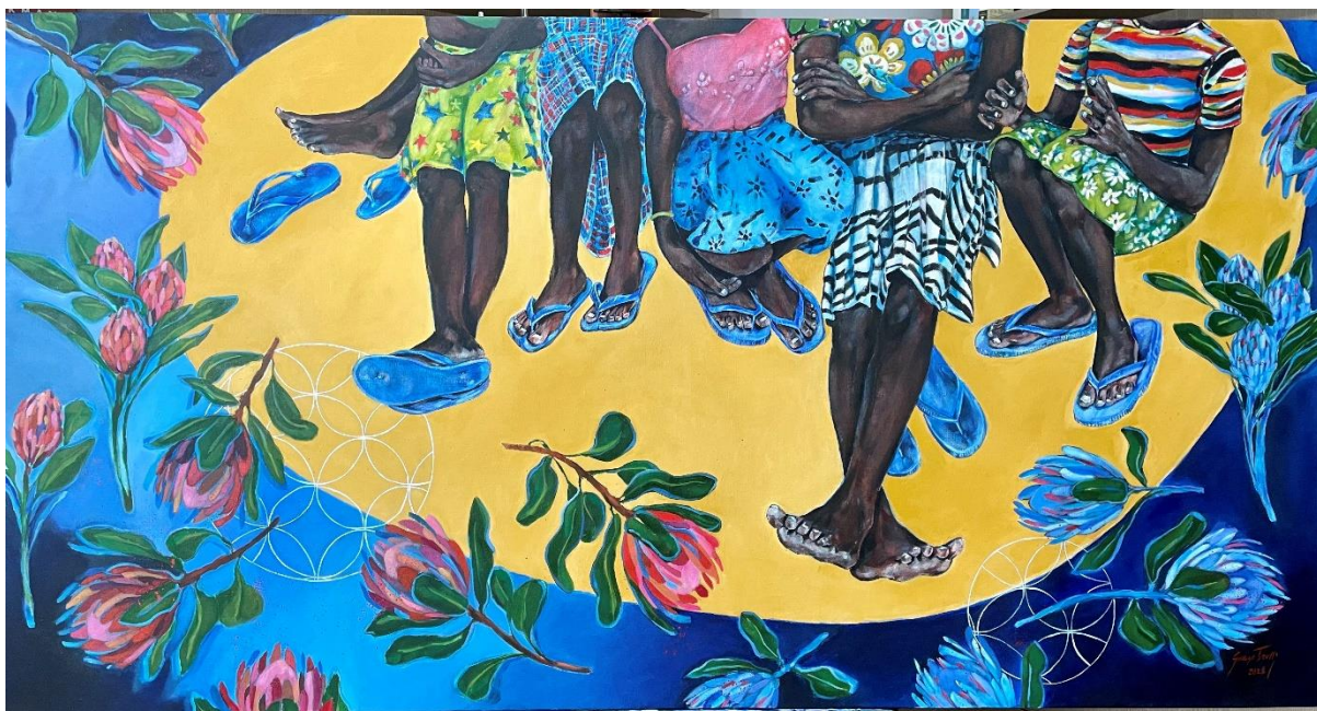
Acrílicas sobre tela – “Protea” / 77cm x 145 cm – 2022.