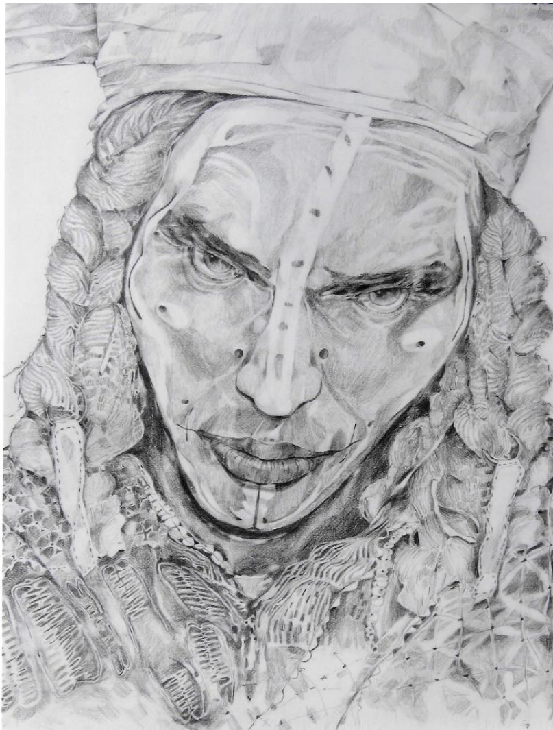
Desenho Grafite "Homo Sapiens Sapiens" / 71cm x 71 cm