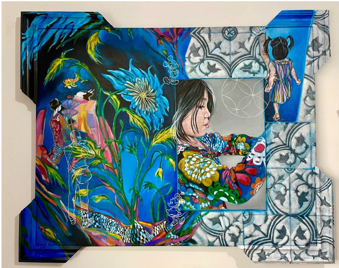
Acrílico sobre tela "Eu sou o que todos somos" ( série Os Submersos) / 83cm x 103 cm – 2021