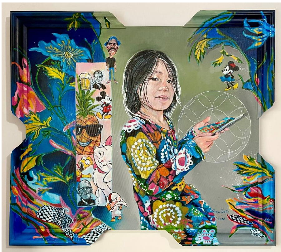
Acrílico sobre tela "Coisa de Criança" ( Série Os Submersos) / 80cm x 90 cm - 2020.