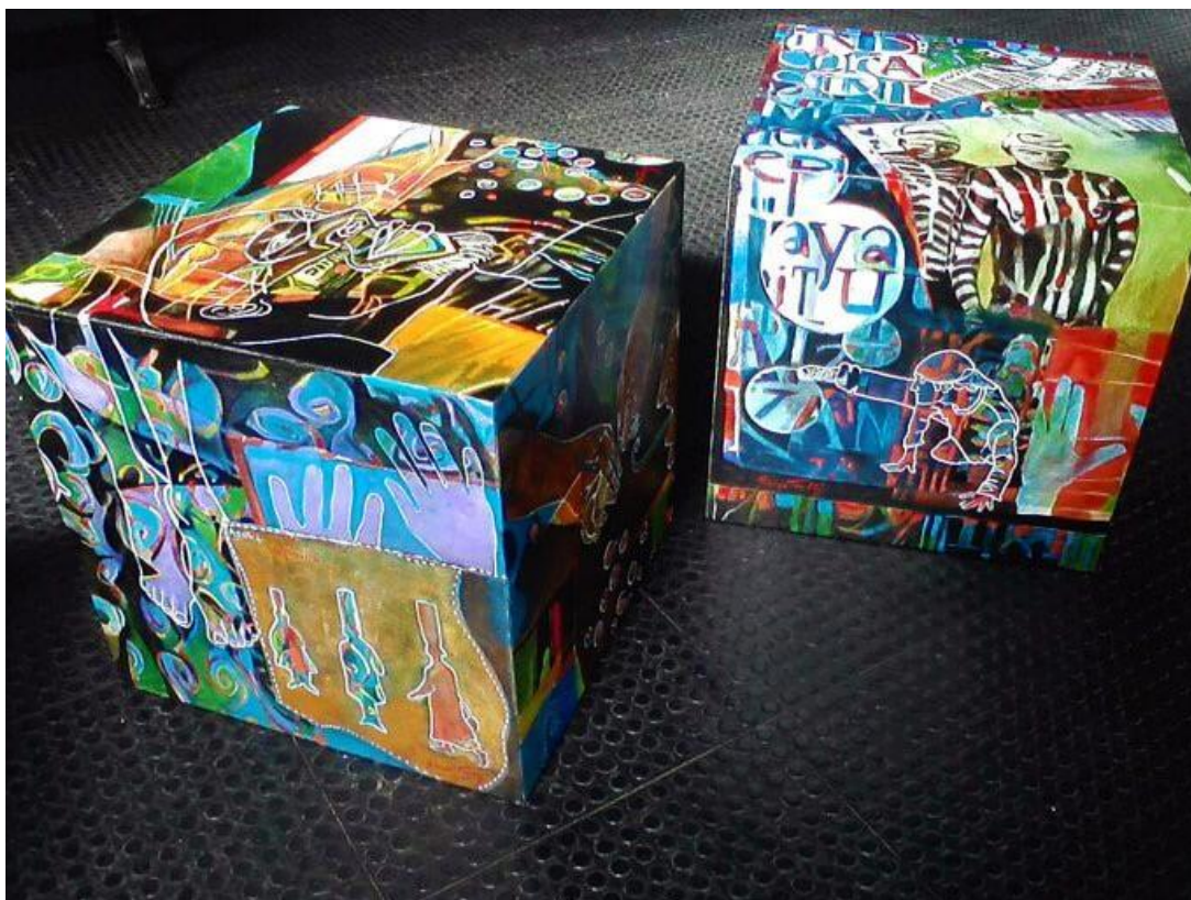
Acrílica sobre tela colada em MDF. [Art]3 / 51cm x 51cm x 51cm . 2018