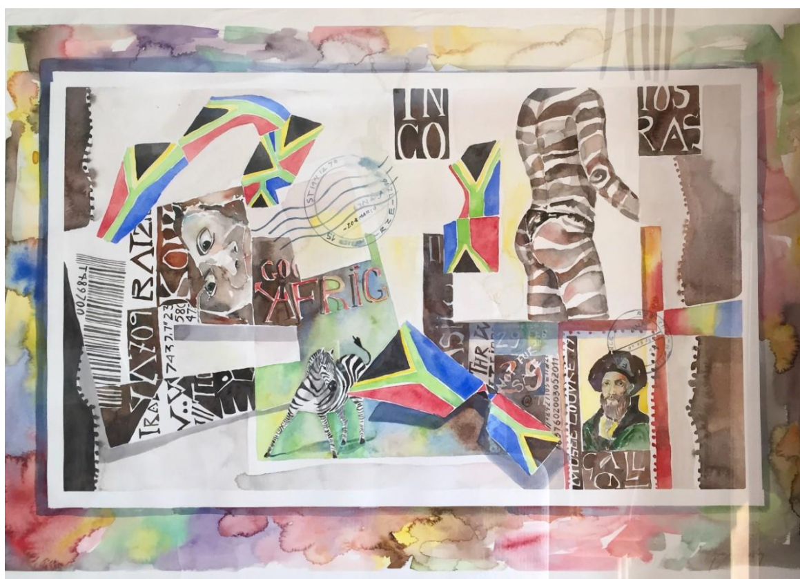
Aquarela / “A Casa Das Máscaras Sagradas” / 70cm x100 cm